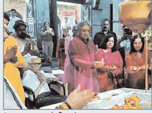
मंदिर के बाहर मीडियाकर्मीयों से मुख्य चुनाव आयुक्त ने कहा- पांच राज्यों (प. बंगाल, असम, तमिलनाडु,

आगरा (एजेंसी)। मुख्य चुनाव आयुक्त ज्ञानेश कुमार आगरा पहुंचे हैं। मंगलवार सुबह 6.30 बजे उन्होंने पत्नी और माता-पिता के साथ कैलाश महादेव मंदिर में पूजा-अर्चना की। पिता का हाथ थामकर आरती की। दुर्गाभिषेक किया। करीब 45 मिनट तक मंदिर में रहे।