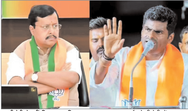
● बीजेपी ने नहीं दिख रहा भविष्य- सूत्रों की मानें तो आईपीएस अधिकारी से राजनेता बने अन्नामलाई को बीजेपी में अपना कोई भविष्य नजर नहीं आ रहा है। बीजेपी की तरफ से अन्नामलाई को

चेन्नई (एजेंसी)। तमिलनाडु बीजेपी के पूर्व प्रदेश अध्यक्ष के. अन्नामलाई ने बीजेपी छोड़ने का मन बना लिया है और इस संबंध में अपना अंतिम फैसला राष्ट्रीय अध्यक्ष नितिन नवीन को बता दिया है। सूत्रों के मुताबिक, मंगलवार सुबह दिल्ली में हुई मुलाकात के दौरान अन्नामलाई ने स्पष्ट कर दिया कि वह अब पार्टी में नहीं रहना चाहते। अन्नामलाई ने पार्टी के शीर्ष नेतृत्व से कहा है कि अब वह अपना रास्ता खुद बनाना चाहते हैं और सोहार्द्रपूर्ण ढंग से अलग होना चाहते हैं। अन्नामलाई लंबे समय से तमिलनाडु में बीजेपी का प्रमुख चेहरा रहे हैं। अब वो नई पार्टी बनाने का मन बना चुके हैं। जल्द ही वो अपनी नई पार्टी को लेकर ऐलान कर सकती है। वहीं बीजेपी उन्होंने किसी तरह मनाने की कोशिश में जुटी हुई है। पार्टी नेतृत्व को अब भी उम्मीद है कि वे अन्नामलाई को रुकने के लिए मना लेंगे, लेकिन सूत्रों के अनुसार उन्होंने अपना मन बना लिया है।